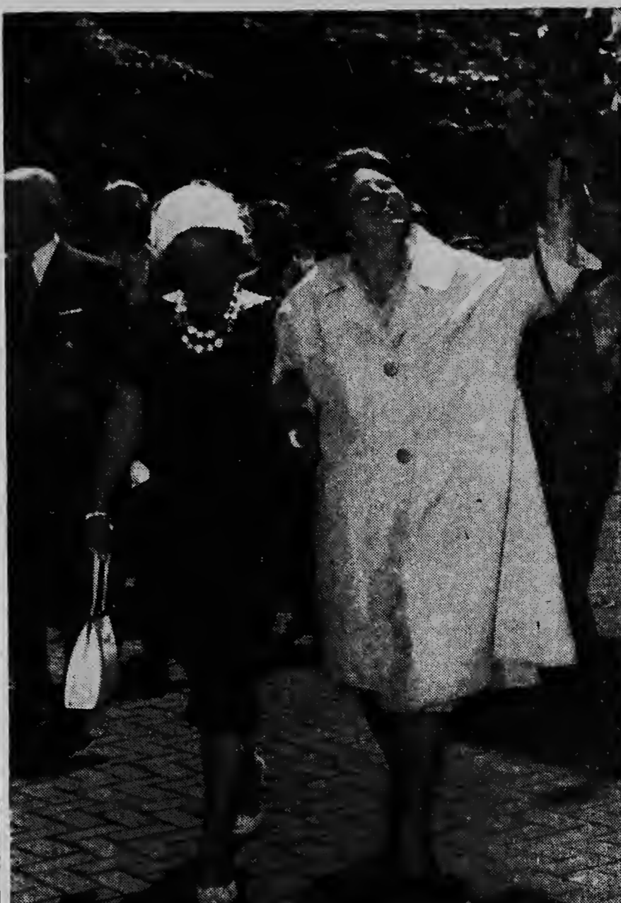
Un Prinses Beatrix brillante ta bandona aki de brazo cu su mama, La Reina Juliana, e edificio di universidad na Leiden, na unda el a pasa su examen doctoral cu bon exito den derechonan (direccion liber di estudio). Muy pronto, hunto cu e demas miembronan di famia real e princesa aki lo bai oza di un vacacion bon mereci. Despues di esaki Prinses Beatrix ta pensa na bai haci algun viaje na estranheria.